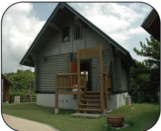
バンガロー（宿泊施設）