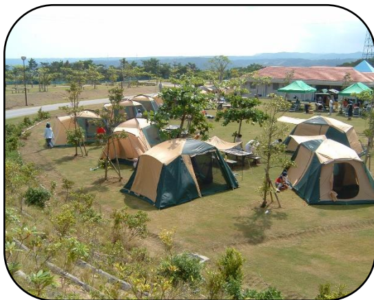
オートキャンプ場